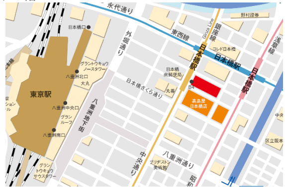
東京メトロ銀座線・東西線・都営地下鉄浅草線「日本橋」駅直結 JR各線「東京駅」徒歩5分

■トライアルご利用可能期間 2024年8月～2025年1月（予定） ※予告なく終了する可能性があります。