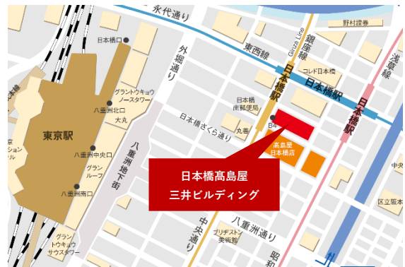
東京メトロ銀座線・東西線・都営地下鉄浅草線「日本橋」駅直結 JR各線「東京駅」徒歩5分

■お問い合わせ先 &BIZ conference 事務局（予約受付窓口） 日本橋高島屋三井ビルディング10階（&BIZ conference 内） 電話：03-3274-3450 Mail： takashimaya10thfloor-conference@mfbm.co.jp 予約受付窓口営業時間：平日9時-17時 ※施設・設備点検等のため臨時に休館する場合を除く