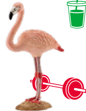
≫≫ Flamingo 片足で寝るフラミンゴのように ビジネスでもバランスを 意識するといいかも。