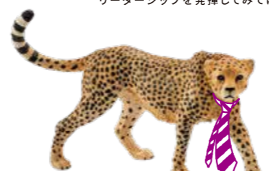
≫≫ Cheetah チータのような瞬発力で ビジネスチャンスを掴もう。