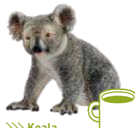
≫≫ Koala ビジネスは体が資本。 疲れたらコアラのように たくさん休むことも大切。