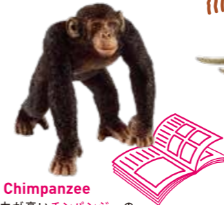
≫≫ Chimpanzee 記憶力が高いチンパンジーの ようにインテリ派を目指してみる のもいいかも。