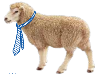
≫≫ Sheep 群れで行動するヒツジのように チームワークを大切に。