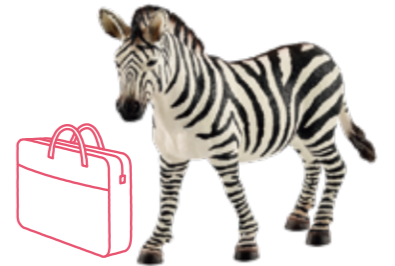
≫≫ Zebra 迷った時は思い切ってシマウマのように 白黒ハッキリさせてみては。