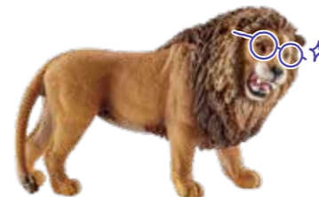
≫≫ Lion ライオンのようにチームの中で リーダーシップを発揮してみては。