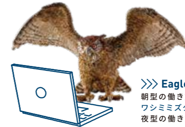
≫≫ Eagle owl 朝型の働き方もあれば、 ワシミズクのように 夜型の働き方もあるのかも。