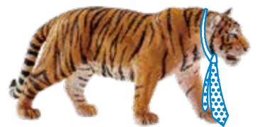
≫≫ Tiger トラのように狙った目標に 向かって全力で取り組もう。