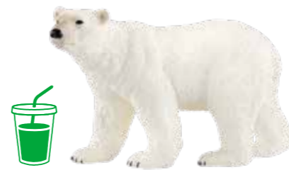
≫≫ Polar bear 議論が白熱した時にはシロクマのように クールになることも大切かも。