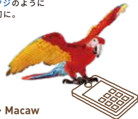
≫≫ Macaw おしゃべりなコンゴウインコの ようにコミュニケーション上手が 大活躍するかも。