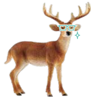
≫≫ Deer 君シカ(オジロジカ)いないといわれる ほどのスペシャルな存在になろう。