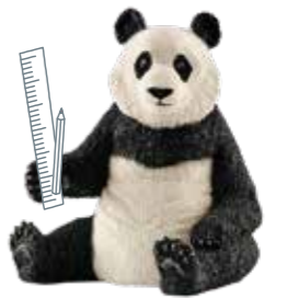
≫≫ Giant panda 人もビジネスも引き寄せる ジャイアントパンダのような 人気者になろう。