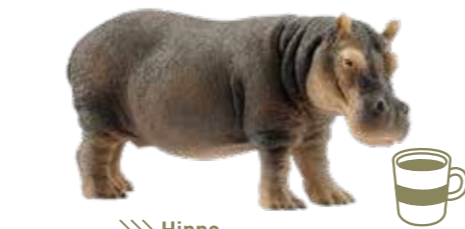
≫≫ Hippo 社交的なカバのようにネットワークを 広げると、チャンスも広がるかも。