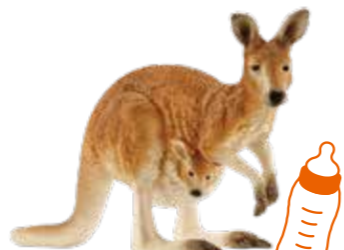
≫≫ Kangaroo カンガルーのように家族の 時間を大切にしよう。