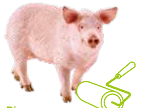
≫≫ Pig クリーンデスクで生産性アップ。 ブタのような綺麗好きが、功を奏すかも。

※ドイツブランド「シュライヒ」のフィギュアです。シュライヒはクリエイティブな遊びを通じてお客様の想像力をはぐくみます。