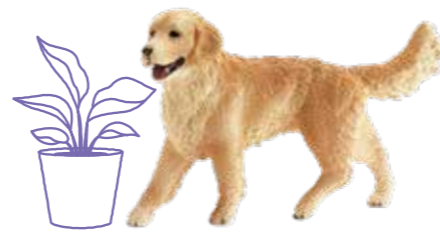
≫≫ Golden retriever 明るくおだやか。社内の信頼を得るのは ゴールデンレトリバーのような人かも。