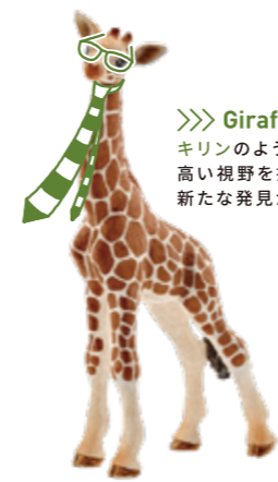
≫≫ Giraffe キリンのように 高い視野を持つと、 新たな発見があるかも。