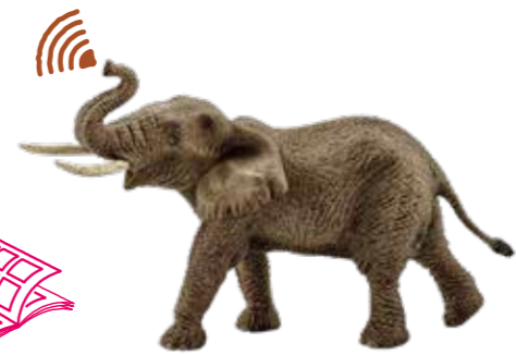
≫≫ African elephant 大きな耳を持つアフリカゾウの ように幅広く情報を集めてみては。