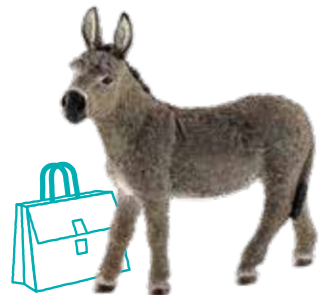
≫≫ Donkey ロバのように歩みはゆっくりでも、 大きなことを成し遂げる人はきっといる。