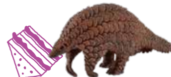
≫≫ Pangolin 忙しい時ほどオオセンザンコウのように しっかり食べて鋭気を養ってみては。