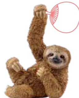
≫≫ Sloth 時にはナマケモノのよう にのんびりすると、 良いアイデアがでるかも。